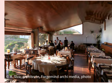
© A. Siza, architegte, Forgemind archi media, photo