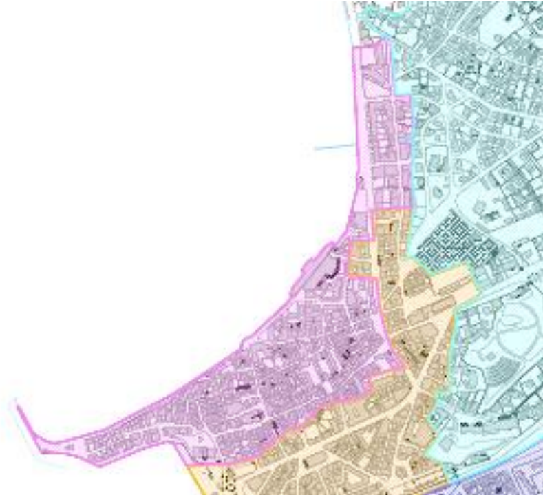
Extrait zonage RLP : zone matérialisée en mauve