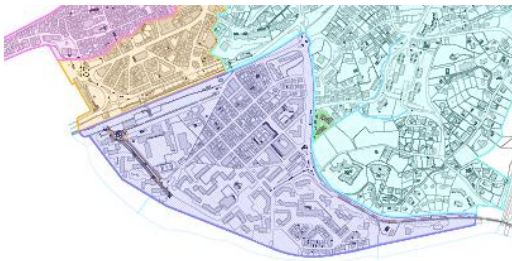
Extrait zonage RLP : zone matérialisée en violet

Cette zone est couverte par le secteur 2 de l'aire de mise en valeur de l'architecture et du patrimoine (AVAP) valant Site Patrimonial Remarquable (SPR).