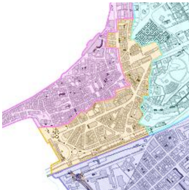
Extrait zonage RLP : zone matérialisée en jaune

De même, cette zone fait partie intégrante du secteur 1 (« vieille ville ») de l'aire de mise en valeur de l'architecture et du patrimoine (AVAP) valant Site Patrimonial Remarquable (SPR).