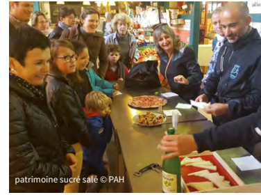
patrimoine sucré salé