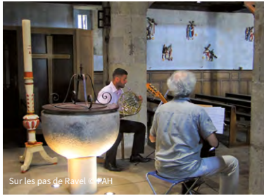
Sur les pas de Ravel