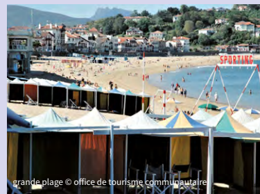
grande plage