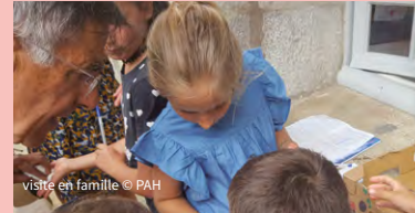
visite en famille