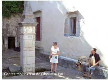
Contez-moi le cœur de Ciboure