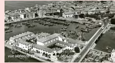
vue aérienne 1950