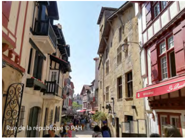
Rue de la république