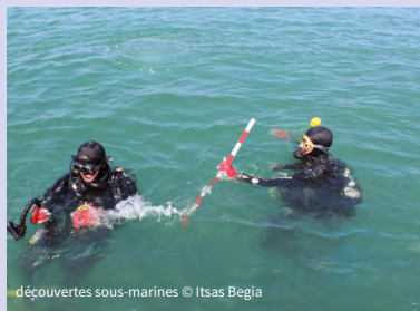
découvertes sous-marines