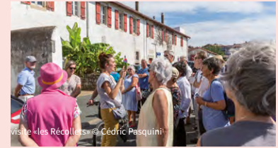
visite «les Récollets»