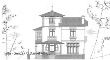
Villa «Geriza» © Daniel Albizu