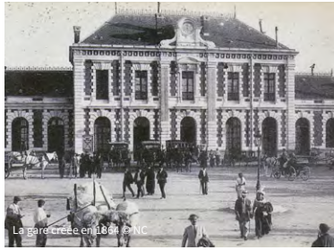
La gare créée en 1884