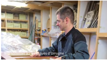
restaurer les orgues d'Urrugne