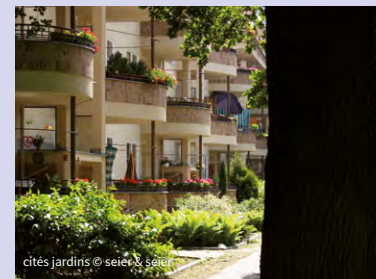
cités jardins