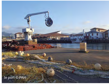
le port