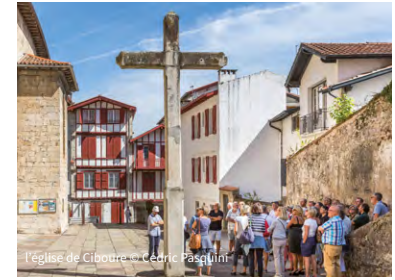
l'église de Ciboure